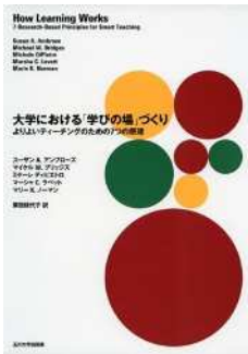
図10 『大学における「学びの場」づくり よりよいティーチングのための7つの原理』

その他、「レポート添削に膨大な時間がかかるが、学生の書く力がアップしない場合どうしたらいいか」といった具体的な教員の悩みに対する、教育手法の専門家からのアドバイスは、パフォーマンス評価が必須のリベラルアーツ教育に携わる教員であれば一読しておくに役立つだろう。