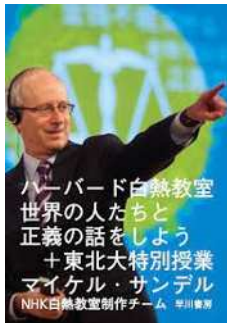
図5 『ハーバード白熱教室 世界の人たちと正義の話をしよう+東北大特別授業』

⑬ ジュリアン・バジニ『100の思考実験』向井和美訳、紀伊國屋書店、[2012]2020年