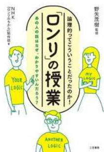
図8 『「ロンリ」の授業 論理的ってこういうことだったのか!』

ディスカッション授業を行う際にまず認識すべきは、意見の対立は、人と人との（感情的）対立とは異なるということである。また、多様な意見が出た際に「考えは人それぞれ」で終わってしまってもいけない。お互いの意見を尊重しながら、どうしたら言葉を使って歩み寄り、合意点を見つけられるか。この本は、そこまで授業で目指すことの大事さと、その実現のための手法を示してくれる。「意見の違いを受け入れつつ、違いを解消しようとする事」、「意見の違いを尊重しながら、人として繋がろうとする事」、これらの相反するよう見える二つの態度を両立させる鍵は、この本によれば「論理性」である。実りあるディスカッション授業を目指す際のヒントが与えられる。