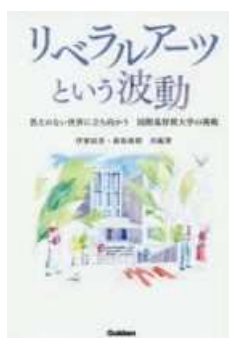
図2 『リベラルアーツという波動 答えのない世界に立ち向かう 国際基督教大学の挑戦』

1952年の建学以来、教養教育を標榜してきたICUは、いわばリベラルアーツ教育界の老舗とでもいべき存在であるが、④を読んでみると、その存在感の源は、常にリベラルアーツ教育の内容・手法をアップデートしていく、時代への適応力であることがわかる。他方、一貫して変わらないのは、世界平和のために尽力する人材をいかにして輩出するかという、やはり教育的情熱である。