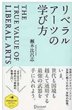
図9 『リベラルアーツの学び方』

裁判官出身の法学者である著者が、リベラルアーツについて語り尽くした本。教える立場からというよりは、自学自習する場合に役立つ本である。本の後半は、リベラルアーツとして親しんでおくべき作品リスト群になっている。理系の本や哲学書に始まり、SF小説、映画、漫画まで網羅している。21世紀の教養はこれらの分野にも及んでいることが実感でき、リベラルアーツ教育に携わるものとしては自分がどのあたりの知識を補強しておけば良いか参考になる。