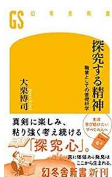
図6 『探求する精神 職業としての基礎科学』

⑭ 大栗博司『探求する精神 職業としての基礎科学』幻冬舎新書、2021年（図6）