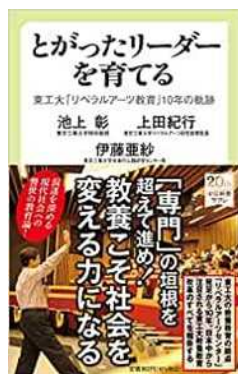
図1 『とがったリーダーを育てる 東工大「リベラルアーツ教育」10年の軌跡』

東工大は、2011年にリベラルアーツセンター（2016年以降、リベラルアーツ研究教育院）を発足させ、今年10年の節目を迎えた。「日本のリーダーにもっと理系の人材を」という使命感のもと、60名ほどの教員がリベラルアーツ教育に携わっている。