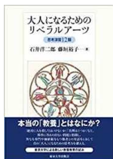
図 3 『大人になるためのリベラルアーツ 思考演習 12 題』

⑧ 石井洋二郎・藤垣裕子『続・大人になるためのリベラルアーツ 思考演習 12 題』、東京大学出版会、2019 年