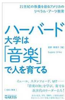
図7 『ハーバード大学は「音楽」で人を育てる 21世紀の教養を創るアメリカのリベラル・アーツ教育』

ハーバードに限らず、アメリカの多くの大学がなぜ音楽科をおいているか。実技だけではなく、鑑賞や批評、そして社会と音楽について言葉で深く語り合う教育をなぜ行っているのだろうか。その答えが得られる本。音楽のリベラルアーツとしての歴史や、どのように音楽をリベラルアーツ授業のテーマにするかなど、歴史解説と具体例もとても盛り沢山で学ぶところの多い本。音楽をリベラルアーツ授業で教える際には必読の書と思われる。